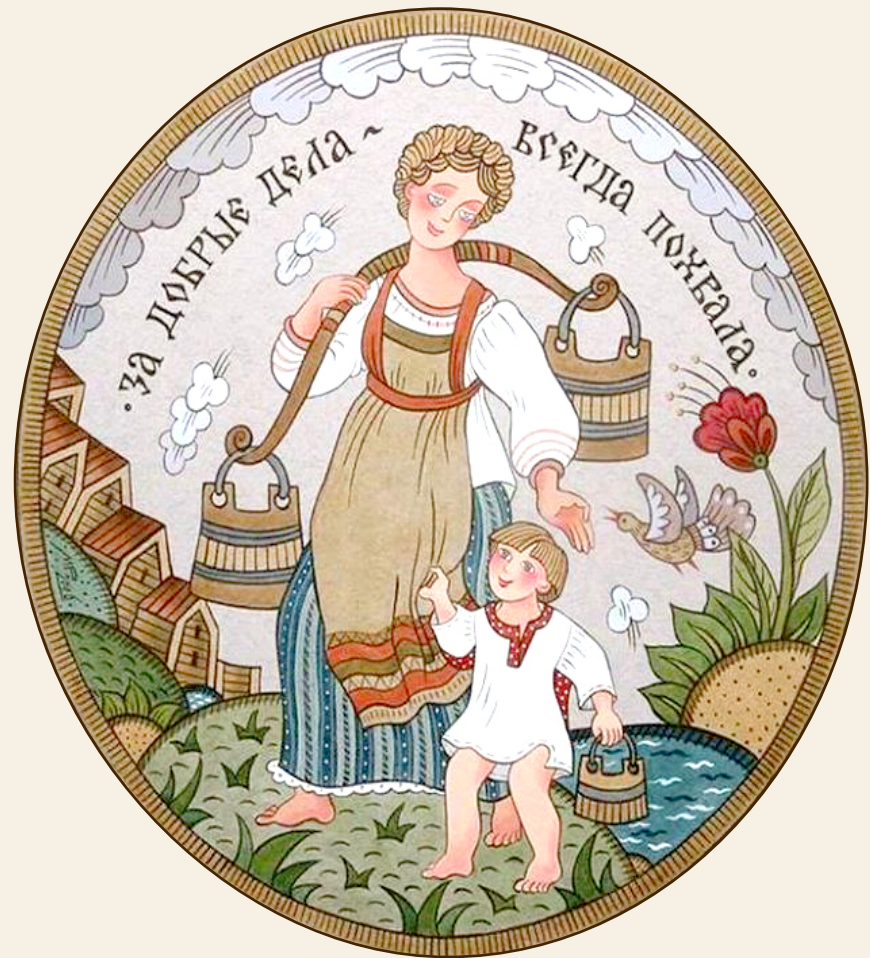
Иллюстрация, русский лубок

Опыт проектов-победителей конкурса «Культурная мозаика малых городов и сёл» подтверждает, что волонтеры зачастую дают первый импульс к качественным изменениям жизни в российской глубинке.