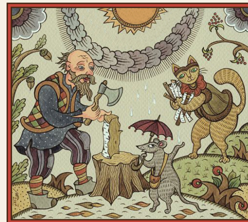
ИЛЛЮСТРАЦИИ К РУССКИМ ПОСЛОВИЦАМ, РУССКИЙ ЛУБОК